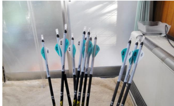
Bohning QuikFletchの例 熱収縮タイプなので熱湯処理します。