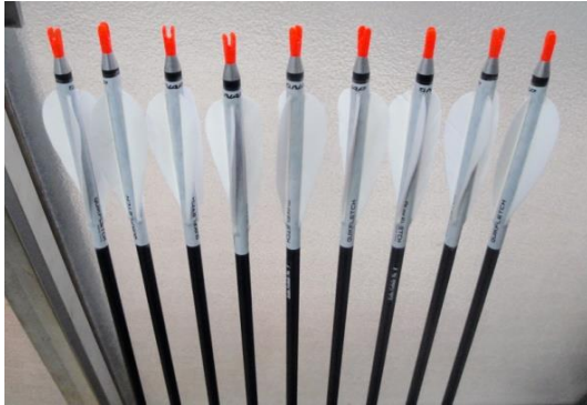
ターキー4インチのイメージ 写真はNVX-23Iにフレッチングしたものです。