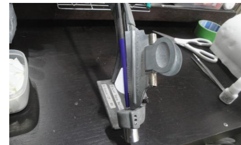
カスタムメイドしたレシーバーとカスタム チューニングしたクランプ・フレッチャー を使用します。