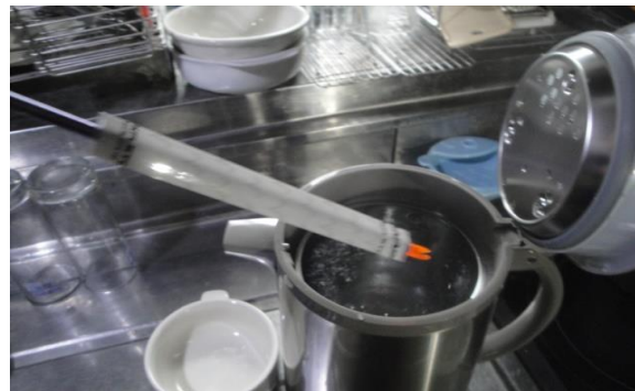
深い鍋・ポットの熱湯で処理します。